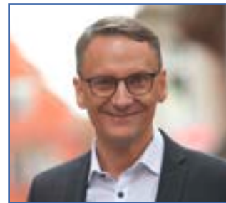
Markus Ibert Oberbürgermeister der Stadt Lahr